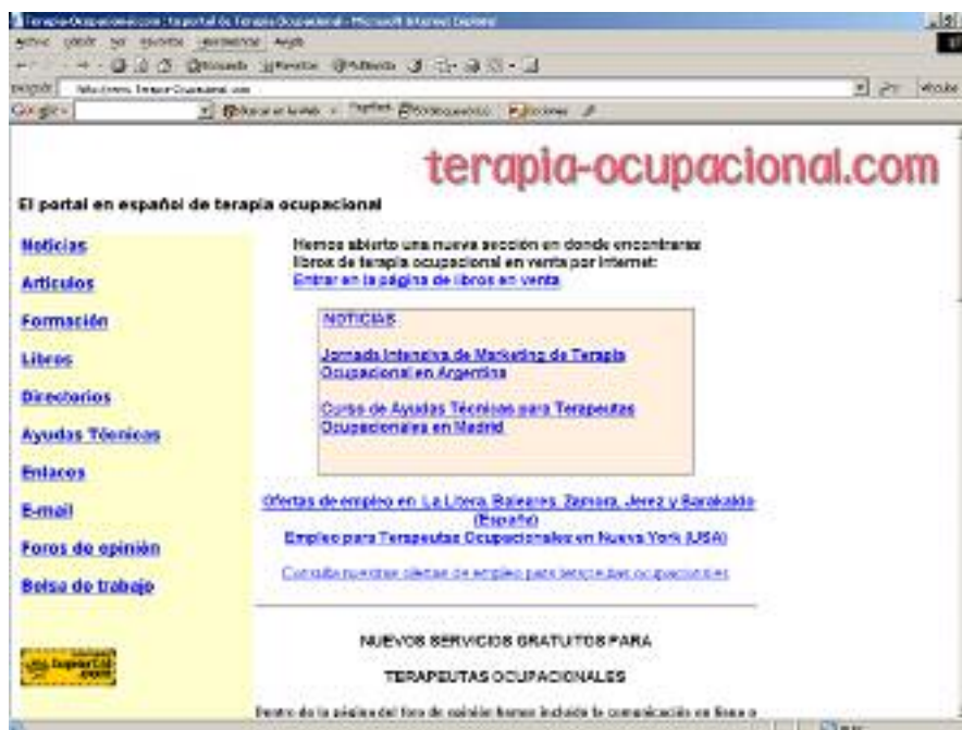
Apariencia de www.Terapia-Ocupacional.com en 2000

Hubo que esperar hasta el año 2000 para que se dieran las condiciones que hicieron posible el nacimiento del Portal de Terapia-Ocupacional.com